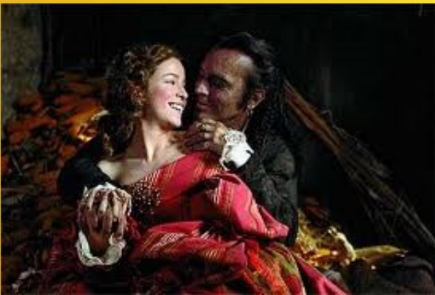
La dama boba